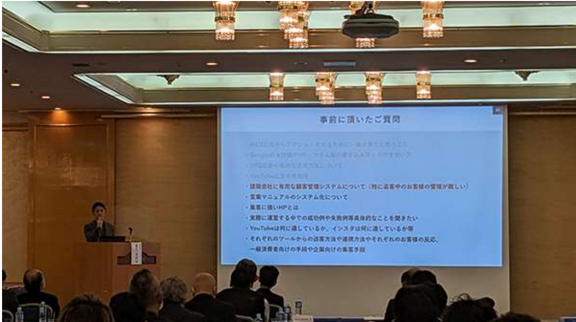
画像は 12 月 16 日に行われた、特別フォーラム内でのセミナーのもの

集客のプロに学べます。モクタウンに搭載されている建築業界に特化したイベント予約システム「ケンガククラウド」の機能を十分に活用して、御社のイベント集客を増やしましょう。