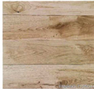
ナラ 厚貼ワンビース ネイチャー