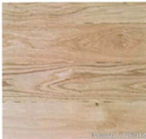
ナラ 厚貼ワンビース バリュース