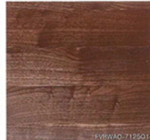
ブラックウォールナット 厚貼ワンビース バリュース