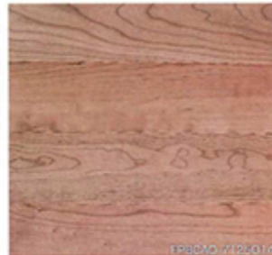
ブラックチェリー 厚貼ワンビース プレミアム