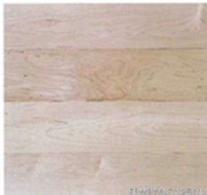
メイプル 厚貼ワンビース プレミアム