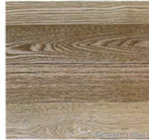
タモ 厚貼ワンビース プレミアム